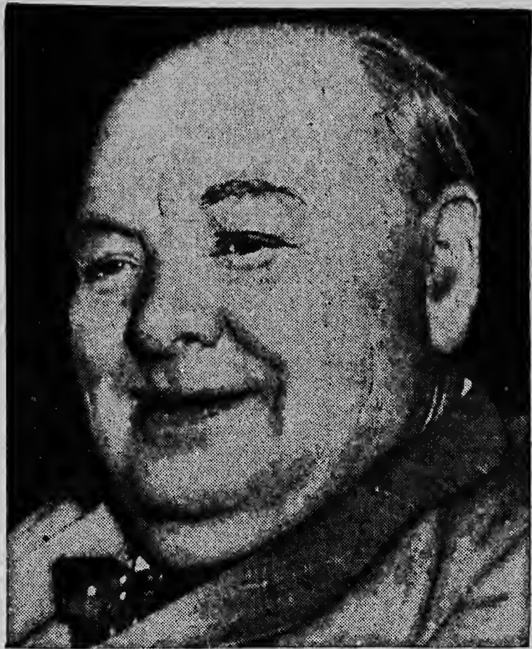
EEN GLIMLACHENDE WINSTON schijnt de wereld te willen laten weten, dat zijn wilskracht nog lang niet gebroken is. Deze foto werd kort geleden gemaakt op Chequers, waar Churchill vertoefte voor rust.

Weldra is het feest voor de Zusters van het Hospitaal en voor de gehele eilandsbevolking. De nieuwbouw van het Hospitaal na dertig maanden voltooiing en wordt vermoedelijk reeds aan het eind van deze week ingebruik gesteld.